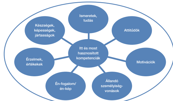
Egy személy kompetenciahalmaza.

A DÉT révén konkrétan, pontosan és folyamatosan bővíthetően 2 beazonosításra kerül az egyén összes kompetenciaeleme (ismerete, tudása, képessége, készsége, jártassága, én-képe, motivációja és attitűdje), melyek a munkaerő-piaci érvényesülését – rövid és hosszú távon is – nagymértékben elősegítik. Ugyanezt a célt erősíti a térkép segítségével elkészített egyéni fejlesztési terv is, mely azon kívül, hogy konkrét, többirányú és gyakorlatias lépésekkel szolgál, szintén bővíthető az egyén további életpályája során.